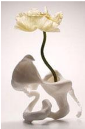
De Airborne Snotty 'Influenza' van Marcel Wanders