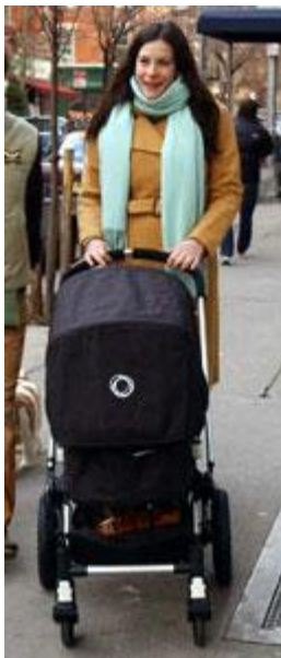
Actrice Liv Tyler met haar Bugaboo

De Bugaboo is een van de objecten die te zien zijn op de tentoonstelling 'The foreign affairs of Dutch design'. Over de schoonheid van het ontwerp valt te twisten, maar praktisch is hij zeker. Zwenkende voorwieltjes met vering; een in hoogte verstelbare duwstang; kleine slimmigheidjes die het leven van de gebruiker makkelijker maken.